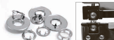
Верхний куб – D, Нижний куб – 4

ВНИМАНИЕ! При работе с установщиком используются мелкие элементы, которые Ваши дети могут проглотить. Храните устройство в недоступном для детей месте!