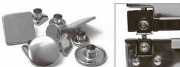
Верхний куб – В, Нижний куб – 1